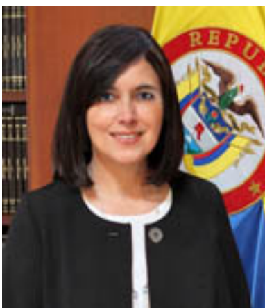
Diana Constanza Fajardo Rivera, magistrada de la Corte Constitucional

Junio 16 de 2017. Se postuló postuló en el cargo el pasó 6 de junio. Abogada y politóloga con Especializa